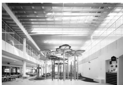
新加坡北部的兒童保育中心