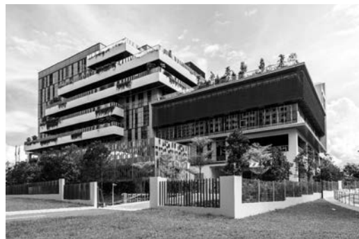
新加坡南部的公營界別樓宇