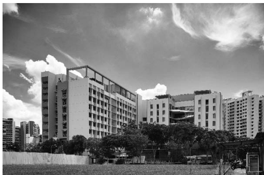
新加坡北部的療養院