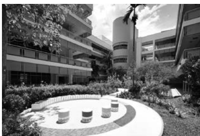
新加坡東部的教育機構

由於我們對建設具韌性的社區的承諾，我們致力於營造安全、便捷及包容的環境。我們的建築項目涵蓋公營、商業及私營部門，豐富生活及提升當地社區的整體福祉。