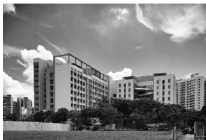
新加坡北部的療養院